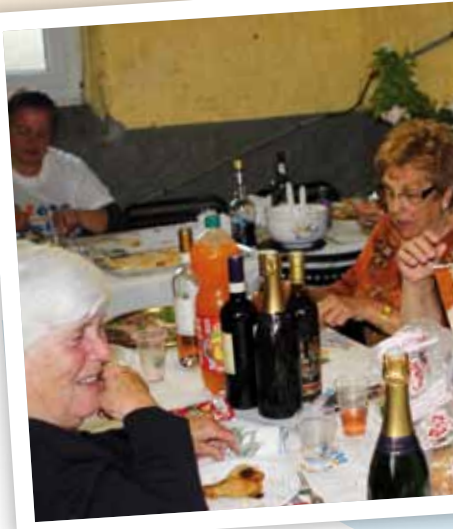
Cité Jules Guesde