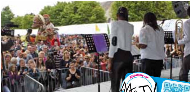
29 mai Festival danses et musiques du monde