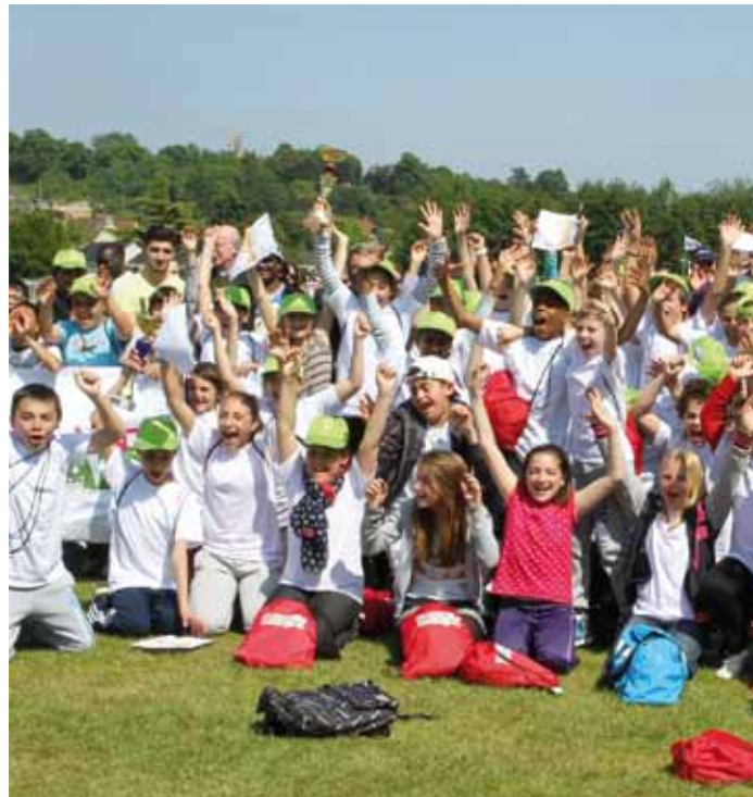
16 mai Les enfants des écoles de Montataire ont participé au rallye citoyen dans la v