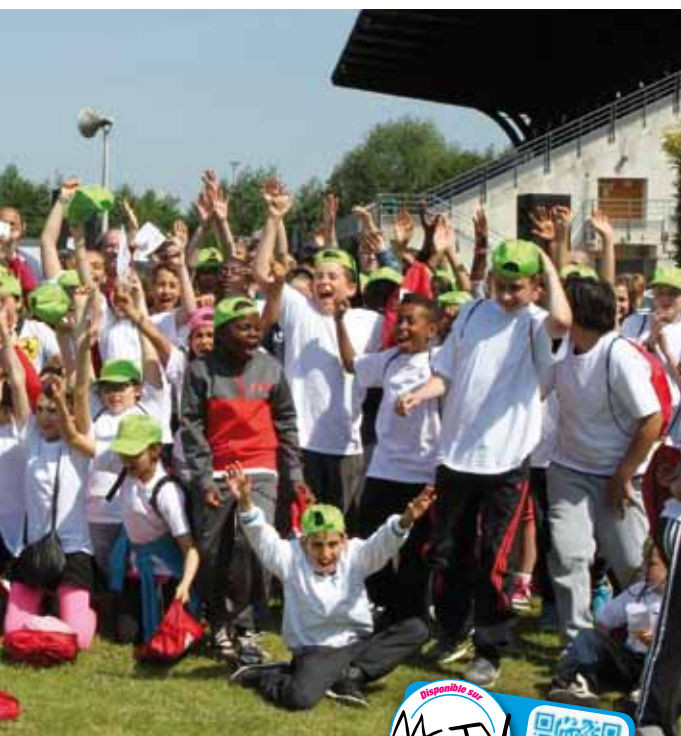
ille à la découverte de nos institutions