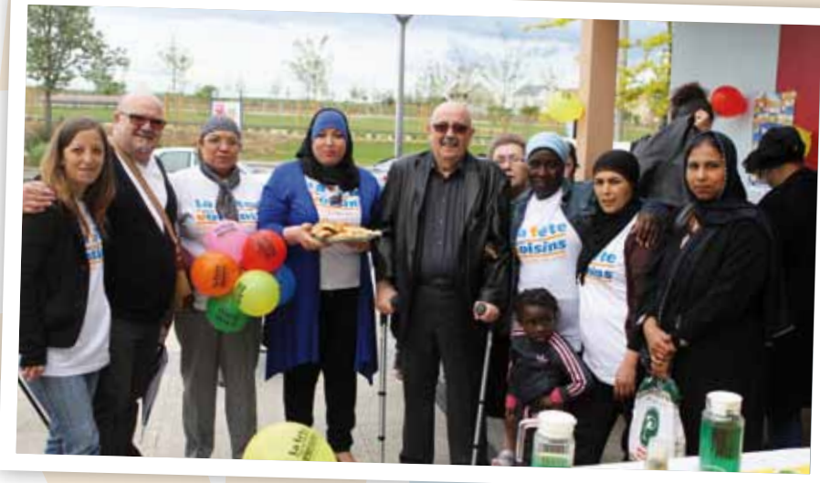
Centre commercial des Martinets