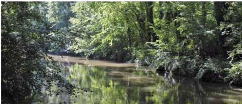
Le Thérain, une rivière accueillante

Informations / contacts : SIVT 03 44 02 10 55 – sivt@orange.fr ■