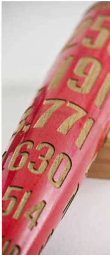
Un boîtier en bois d'olivier, gravé d'une phrase symbolique en arabe et en français. Ce boîtier renferme un crayon et un petit document explicatif de la démarche du jumelage avec le camp de réfugiés palestiniens.

Cet acte inédit, pas facile à l'époque, a, depuis, été relayé par d'autres collectivités. Plus de 90 villes jumelées signifient ainsi concrètement leur volonté de voir reconnaître les droits bafoués d'un peuple, affirmant ainsi concrètement leur solidarité active.