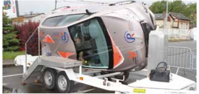
24 mai Journée de la sécurité routière sur le parking du magasin E. Leclerc