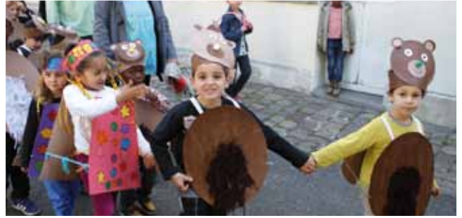
16 mai Carnaval de l'école Jean Macé