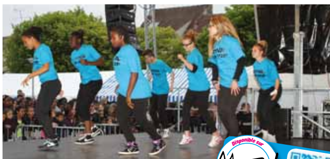
28 mai Festival Hip Hop sur la place de la mairie