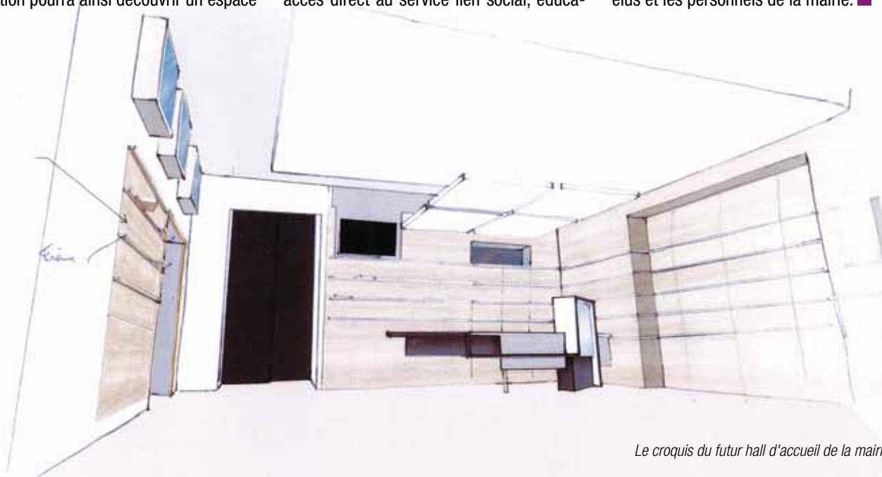
Le croquis du futur hall d'accueil de la mairie

tion et culture, banque d'accueil modernisée). Le coût des travaux est de 130 000 euros et c'est le cabinet d'architectes Dumon qui a réalisé les plans de cette nouvelle structure d'accueil, en lien avec les élus et les personnels de la mairie. ■