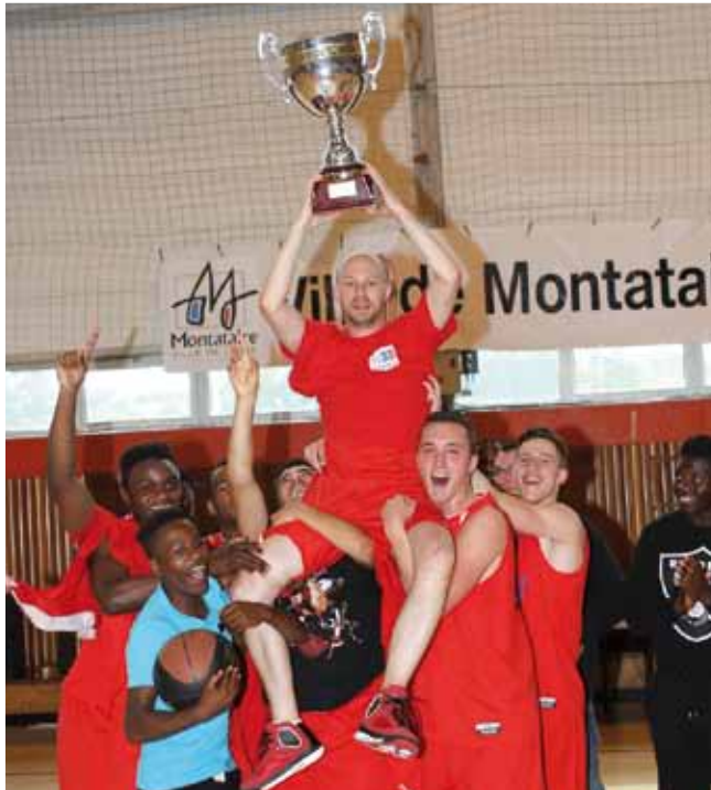
24 mai Finales de Coupe de l'Oise de basket à la salle Marcel Coene organisées par le Montataire Basket-ball. Bravo aux équipes réserve et junior qui sont championnes de l'Oise 2014