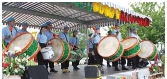
25 mai Festival des groupes folkloriques portugais au centre de loisirs Pierre Legrand organisé par le "Souvenir du Portugal" de Montataire