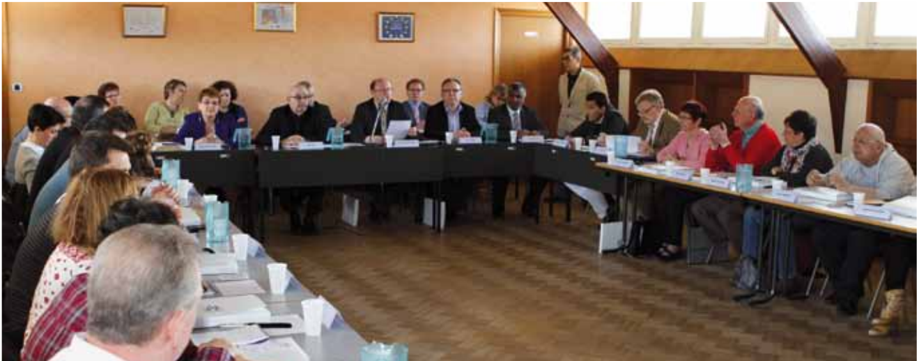
Le conseil municipal